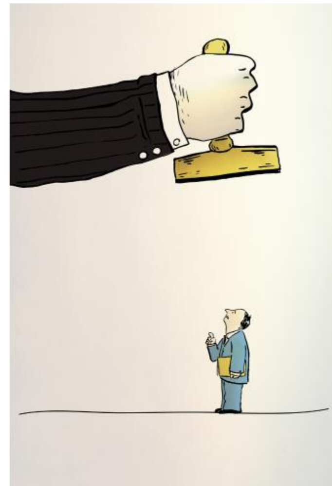
Título: Dolorosos trámites Autor: Diego Maximiliano Flisfisch País: Chile

*Indicador anual elaborado por el Banco Mundial en 190 economías.